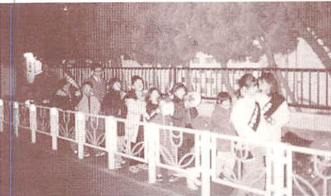
ジュニアパトロール隊

トロールの強化や、高齢者を狙う悪徳商法の対策講演会等、自助、共助、公助の意識の高揚に努めています。またジュニアパトロール隊と称して小学生から高校生の子供たちがパトロールに協力しています。子供の頃の地域活動の体験は、将来的にも大変意義あることと期待しています。