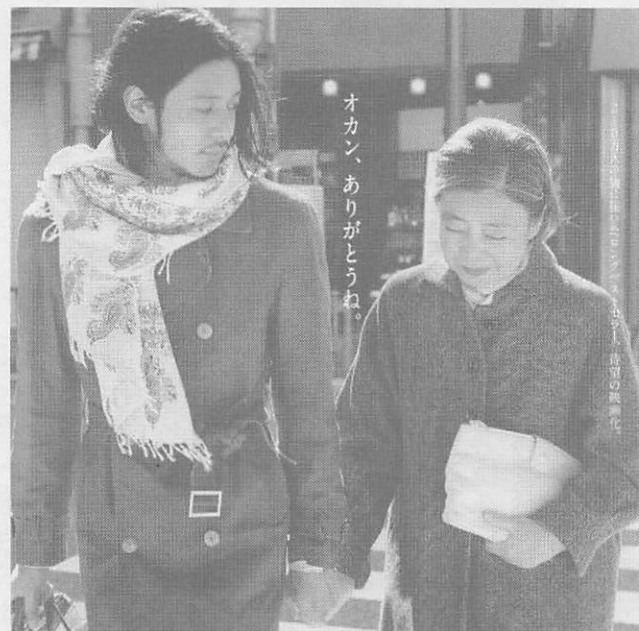
オカン、ありがとうね。