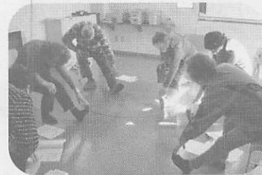
自主グループ『東松会』での転倒予防体操

ケア24とは、その名前の響きから、ケアをしてくれるところ、介護保険に関する相談をするところとお考えになる方も多いかと思いますが、介護保険に関する相談はもちろん、地域の方々がいつまでも住みなれた地域で生き生きと暮らしていただくための様々な福祉サービスの案内や支援を行っています。その支援の中の一つに、介護予防事業サービスの案内があります。