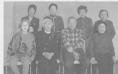
『東松会』のメンバー

介護予防事業とは、転倒予防、筋力アップ、栄養改善、口腔機能向上、リフレッシュ！リハビリなどの教室に参加し、専門家の指導のもと、元気なうちから10年後も今と変わらずに過ごすため、心身の衰えの予防と回復を目的とし、65歳以上の方を対象に実施しています。 松ノ木地区では、この転倒予防教室に参加したメンバーの中から『東松会』という、転倒予防体操とメンバーとのお茶を楽しむ自主グループが立ち上がっています。立ち上げ当初の登録メンバーは5名。欠席者がいると参加者は3名となることもありましたが、新規加入メンバーも増え、立ち上げから約2ヶ月経った今では9名まで増えてい