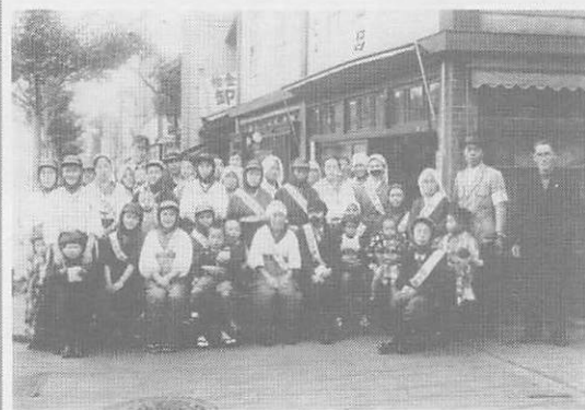
昭和18年高円寺南2丁目防火隊 (旧高円寺3丁目)