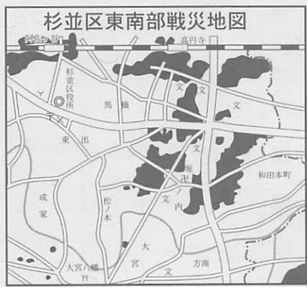
杉並区東南部戦災地図 森泰樹氏編「杉並風土誌」より (黒塗り部分が消失)

この杉並地区でも特に二十年五月二十三及び二十五日の両日、高円寺、堀ノ内、和田本町、方南、和泉、永福などが甚大な被害をうけた。夜間