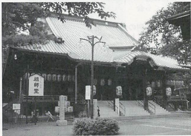
現在の妙法寺祖師堂

まだこの杉並が東多摩郡堀之内村と呼ばれているころの話です。今から一〇年前にもなります明治十四（一八八二）年十一月、そろそろこの辺の農家も商店の人々もお会式も終わった冬支度を始めたころです。