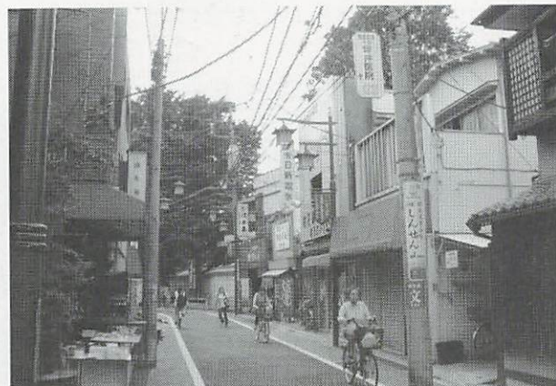
現在の参道商店街

しかし、この程度だったら、まあ、こそ泥として許せるのでしようがこの男は、これに味を占めて翌十五年にかけて五、六回も忍び込み、その都度、衣類、現金などを盗み、その他すぐ近くの質屋の大高方にまで忍び込み手当たり次第片っ端から盗みました。この辺も妙法寺道はまだ中野鍋屋横丁に