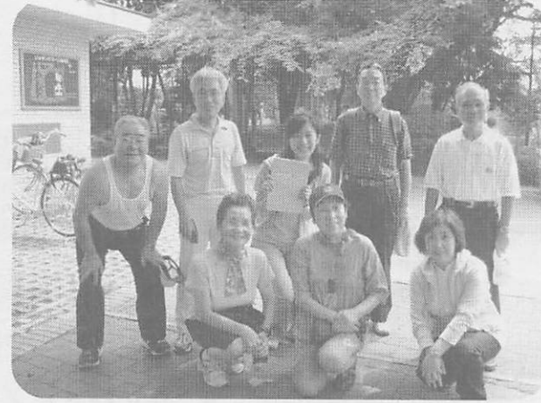
お互いの顔の見える地域づくりもケア24の大切な仕事と考えています。

体と心と頭が健康であれば、毎日が楽しく過ごせます。そのためには、仲間と一緒に、元気に体を動かすよう、ウォーキングなどがよいと言われています。ケア24梅里では、「歩く好奇心教室」を経てきたウォーキンググループのサポートもしています。 「蚕系の森公園に行く」と、ウォーキングの仲間がいる」、「史跡めぐりもしてみたい」、そんなグループが生まれました。 介護の相談を受けるだけではなく、