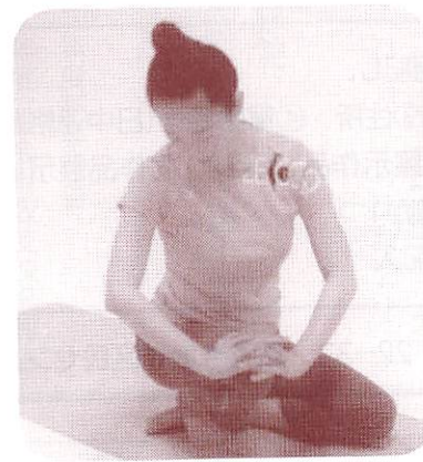
自分でほぐしてスッキリ