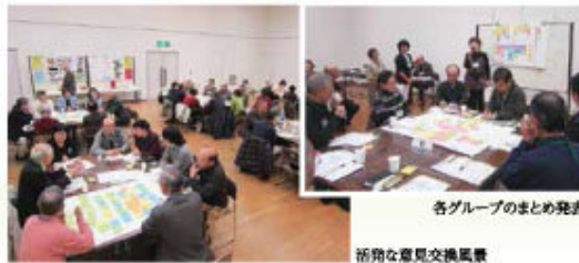
各グループのまとめ発表

懇談会終了後、多くの参加者から「この懇談会を今後も続けてほしい」との声があり、各団体もこうした生の意見交換の場を求めていることがうかがえました。