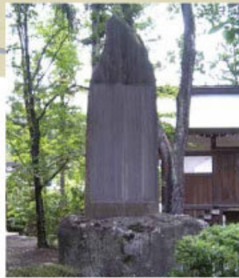
佐久間象山「望岳賦碑」(長野市松代町・象山神社)