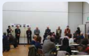
プレゼンターの紹介