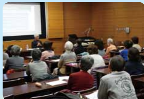
がんばらないために、良きアイデアを教授いただきました。

ガーデニングを楽に行うためには、最初の計画が大切です。植える場所の日当たり、土の性質などに合った植物を選び、植物の力に任せると上手く行くと、特に面倒な「耕す、草取り、水やり」の手抜きの方法を説明されました。