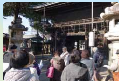
熱心に妙法寺の説明を聞きました。

妙法寺の仁王門から寺院施設である祖師堂、本堂、二十三夜堂、日朝堂、大玄閣、御成の間などほとんどの場所の案内・説明を頂きました。参加者は、近くに住んでいても知らないところを見学し、詳しく説明頂いて感激した様子でした。