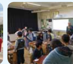
杉八小教室での、百人一首大会です。

★こたえは「しんにゅうせい」でした。小(ちい)さな体(からだ)に黄(き)いろいランドセルが、とても大(おお)きく見(み)えるね。