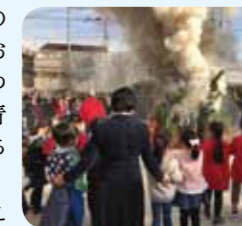
杉小校庭での、どんど焼きの様子です。