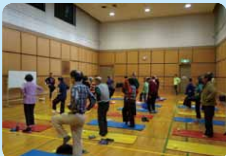
講師の励ましで、体を動かす皆さん。

転倒の原因を分類して、分かりやすい説明を受けた後、「転倒は、老化で仕方ないではなく、体の退化ですから、体を動かさず必ず進化したし、予防できます。」との励ましのもと、皆さん、自分に見合った負荷で各種の体操に挑みました。