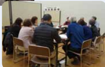
真剣に話し合う地域の皆さん