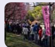
梅里産の梅を求めに集まる皆さん。

72本の梅が咲きほころぶ梅里公園で地域の絆の向上を図るため梅里一丁目町会主催の「梅里まつり」が行われました。当日は、甘酒・ひな菓子・花の無料配布をはじめ、野点を催し来場者にお茶がふるまわれました。また、杉並第十小学校4年生児童たちが授業の一環で、町会の人々と同校児童との共同作業で昨年6月に採集した梅で作った梅干しを販売しました。同校児童の合唱音楽会を行い、早春のひと時を楽しく過ごしました。