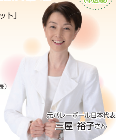
元バレーボール日本代表 三屋 裕子さん

いじめをなくすことをテーマに8月4日に開催された「中学生生徒会サミット」での中学生の真剣な取り組みを受け止め、大人がすることを考えます。多くの区民の皆様のご参加をお待ちしています。