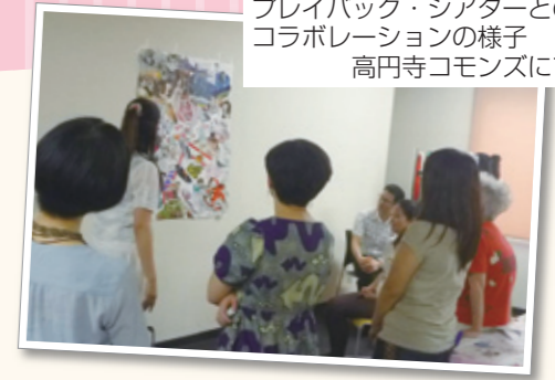
プレイバック・シアターとの コラボレーションの様子 高円寺 commons にて

当法人の本体は、2005年6月に設立したNPO法人です。各地に支部を展開し、その地域に合わせて活動しております。本協会の設立目的は、広く一般市民を対象として、絵画・陶芸・コラージュなどの創作活動によるカタルシス(癒し)効果や創作された作品を投影分析(心理学)的に理解し、その内容をコミュニケーションの手段として役立てるためのクリエイティブ・セラピー(創作療法)の普及啓発事業や調査研究事業およびクリエイティブ・セラピストの認定事業を通して精神的・生活面の安定や発達・自己実現に寄与し、福祉の増進を図ることを目的としています。