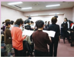
身体全体で声を出して～