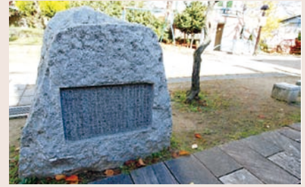
梅里児童公園 (2014年12月5日撮影)

こんな身近なところに、小説『恍惚の人』の舞台があったとは驚きです。また、認知症の人