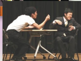
若手コンビ「マッハスピード 豪速球」の熱演