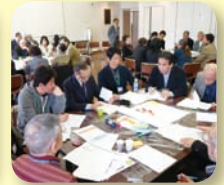
盛り上がる意見交換