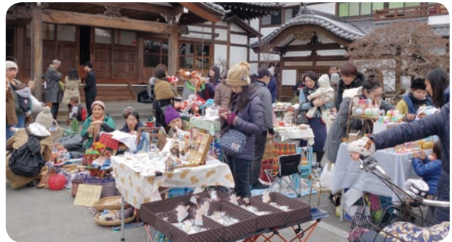
子ども連れの参加者でにぎわう境内

事務局の方々は、自分にもささやかなご褒美があり、みんなも喜んでくれるから、続けていけるとのこと。これからも