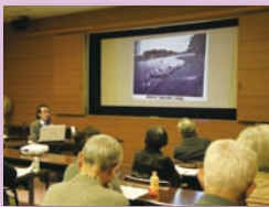
江戸時代と現在の街道の比較