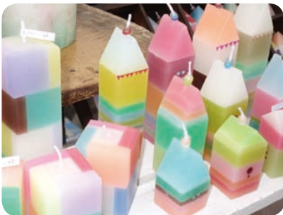
手づくりのこだわりの品々がブースに並び

開催は年2~3回程度。出店者は身体と心によいものを扱うことにこだわった、高円寺地域を中心に活動する杉並区のお店や個人です。事務局はボランティアで企画はすべて手づくりです。力を抜いた等身大の運営を心掛けています。参加者は出店、来場ともに子ども連れの方が多いため特徴です。みんなで子ど