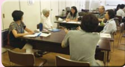
持参した本について熱く語る参加者たち

高円寺図書館の職員の方などの話しを聞いたり、「本を通してまちとふれあう」新しい試みでした。