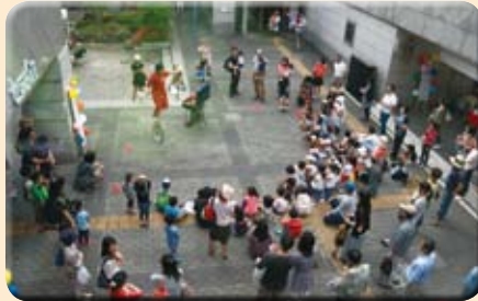
中庭では、恒例の大道芸パフォーマンスに人だかりが