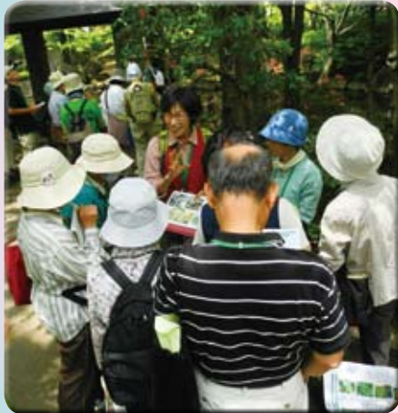
熱心に解説を聞く参加者たち