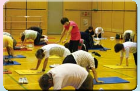
体をゆるめる・筋トレ・ストレッチの3つが大事!

★こたえは「キリボシダイコン」でした!ほすことなまのだいこんよりあまくなり、えいようもぐっとふえるんだよ! はやほねをじょうぶにするカルシウムがたくさんふくまれています。にんじんやしいたけといっしょにこむとおいしいよ。