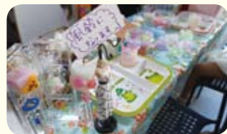
蠟を固めて作るオリジナル風鈴