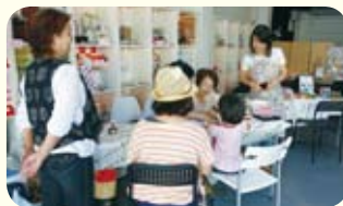
お子さまも大喜びのワークショップ