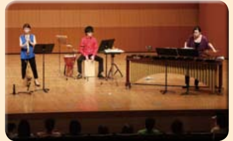
パーカッションのライブでは、観客が一体になって楽しみました