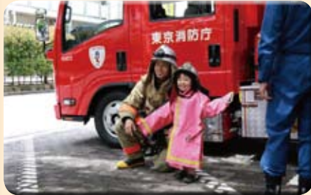
子どもたちに大人気の消防車への乗車、消防服も体験!

初日には「パーカッションに魅せられて!」と題しパーカッションユニットのライブ演奏があり、邦楽・洋楽の名曲に聴衆はタイトル通り、その演奏・音色に魅せられていました。翌日の「踊れ!高円寺阿波おどり」は例年にも増して入場制限をせざるを得ない程のお客さまでした。そして今年はソーシャルダンスレッスンやフィットネス体験、子育て支援サロンなど大人の雰囲気たっぷりの内容ということもあり、子どもから高齢者まで各世代の方々に喜んで頂けたようです。ご来場頂いた皆様、並びにご協力頂いた皆様に感謝いたします。ありがとうございました。