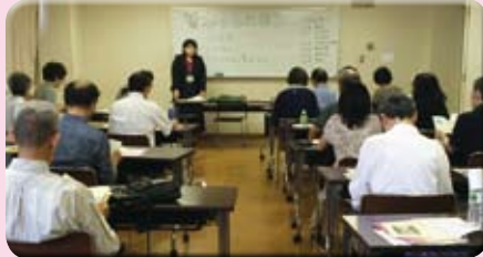
高円寺図書館の取り組みについて話していただきました