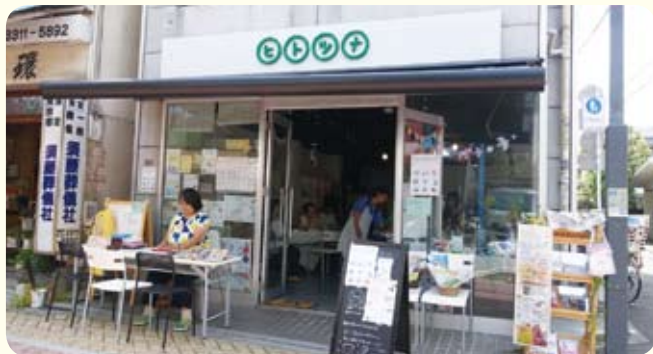
商店街を歩く人の目に留まる外観