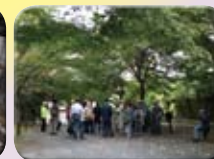
樹木の豊富な緑道をのんびり散策しました

★こたえは「としこしそば」でした! みんな、わかったかな? そばはからだをつくる「たんぱくしつ」をたくさんふくんでいます。びたみんBもほうふです。つよいからだをつくるためにおそばはとってもよいたべものです。としこしそばはのこさずたべて、らいねんもげんきにすこせらるようにしましょう!