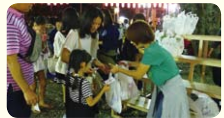
笑顔の千日紅無料配布