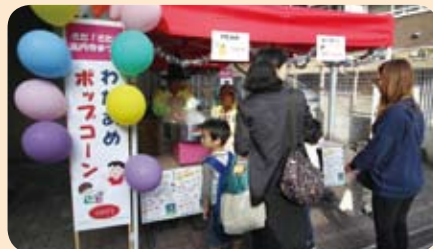
列が絶えなかった、わたあめとポップコーンの販売コーナー