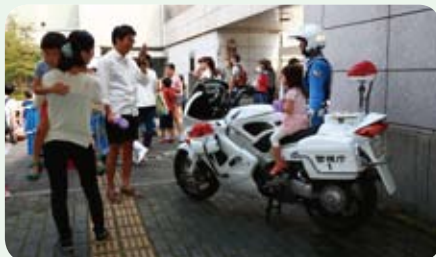
毎回大人気の白バイ体験で、隊員と記念撮影