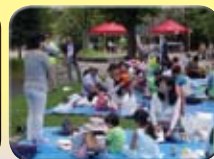
親子で街を歩いたあとは 梅里公園でピクニック