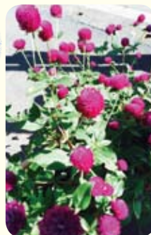
暖かみある地域の手作り千日紅