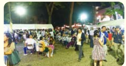
賑わう日暮れの妙法寺境内

お問い合わせ: 千日紅市PROJECT 03(3311)0725 info@sen-nichi.com http://www.sen-nichi.com