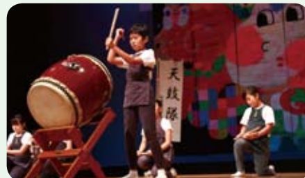
杉並第四小学校「天鼓隊」の、勇壮な和太鼓演奏