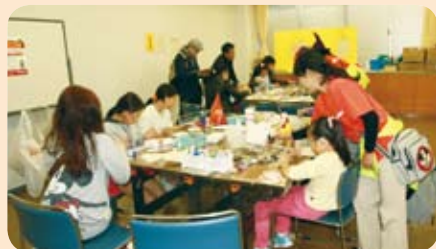
好評の企画で、みんな思い思いの絵を無心に描いていました