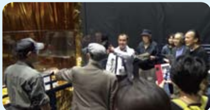
宇宙ステーション補給機 (HTV)「こうのとりの説明