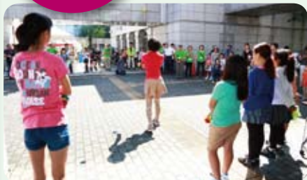
オープニングは松ノ木小学校ジャグリング部の演技で

今年の「こどもフェア」は、秋晴れの好天のもと松ノ木小ジャグリング部の演技によるオープニングセレモニーで幕を開けました。ホールでのダンス、和太鼓、阿波踊りをはじめプラネタリウム、プラバン工作、さらに展示室でのハート・トゥ・アートによる「夢のアート空間」など各会場からは子どもたちの笑顔、歓声があふれていました。たくさんの皆さまのご来場ありがとうございました。また来年お会いできるのを楽しみにしております。