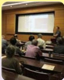
熱心に話を聞く参加者