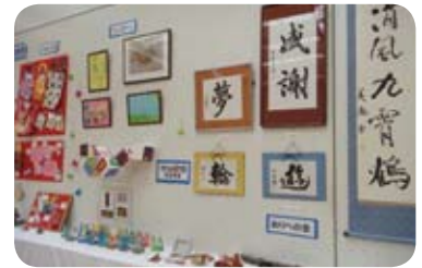
ふれあい美術展での作品展示

問合せ:杉並区障害者施策課 電話 03-3312-2111(代表) FAX 03-3312-8808