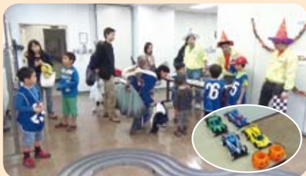
ベスト型ゼッケンを着けてミニ四駆でバトルする小学生たち