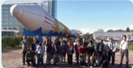
巨大なH-IIロケットを背景に記念撮影