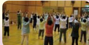
氣功は呼吸法とゆっくりとした動きが特徴です。