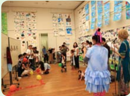
ハートトゥーアートの会場で楽しむお子さんたち