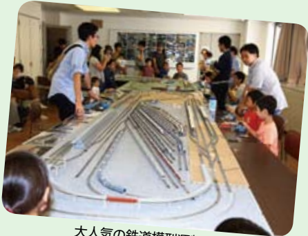
大人気の鉄道模型運転会

れていました。このように多種多様な催しが展開され、こどもたちの笑顔と歓声が会場全体にあふれていました。この日だけで3,000人の皆様が来場され、秋の一日を十分楽しんでいただけたと思われます。地域の皆様のご協力に感謝申し上げます。来年またお会いできるのを楽しみにしております。