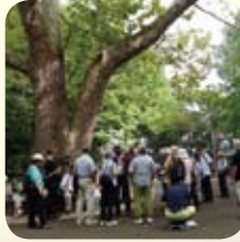
大木に圧巻。おいしい空気を全身で味わいました。