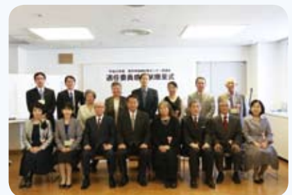
区長と退任委員の記念撮影