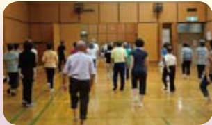
バランスをとりながらの足踏み