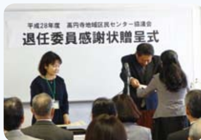
退任委員感謝状贈呈式