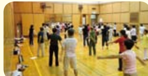
大勢の方にご参加いただきました。