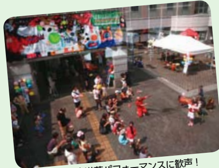
晴天での大道芸パフォーマンスに歓声!