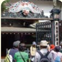
妙法寺鉄門(重要文化財)