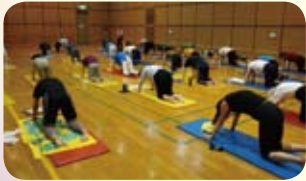
マットを使った体操