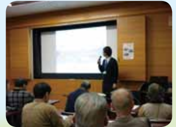
スライドを交えた、分かりやすい解説でした。