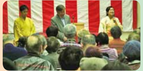
笑いを楽しみに、大勢のお客様が集まりました。