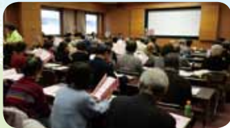
介護現場の報告から、現実的な情報を得ることが出来ました。

どうしても思い出せない人の名前などを、何とかして思い出すことが大事とのことでした。認知症の予防になるそうです。