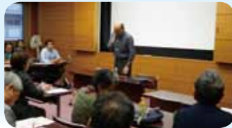
講師のお話により、多くの方が熱心にメモを取っていました。