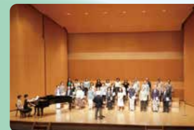
「セッション杉並まつり」大ホールにて「パーカッション」に魅せられて!

★こたえは「こいのぼり」でした。鯉(こい)が川(かわ)を元気(げんき)に泳(およ)いで上流(じょうりゅう)にさかのぼっていくことから、元気(げんき)に強(つよ)く育(そだ)ってほしいという願(ねが)いがこめられているんだよ。