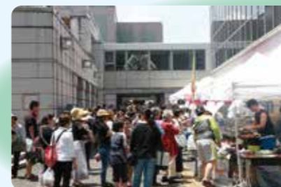
「セッション杉並まつり」で賑わう改修前の「セッション杉並」玄関前

参考文献:(仮称)杉並区立社会教育センター及び併設(仮称)杉並区立高円寺地域区民センター建設基本構想