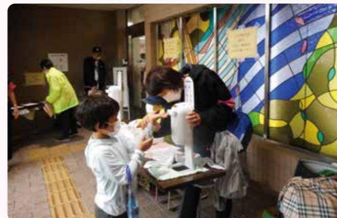
入場前には手指の消毒を徹底しました

地域の子供たちがおまつりの再開を待っていてくれたことを実感しました。ご来場のみなさま、ありがとうございました。