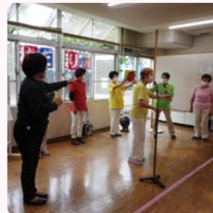
手話サークルによるコーラスとゲーム