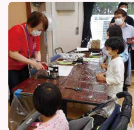
思い思いの絵を描いて缶バッジづくり