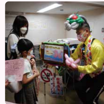
パルーンアートに目がくぎづけです