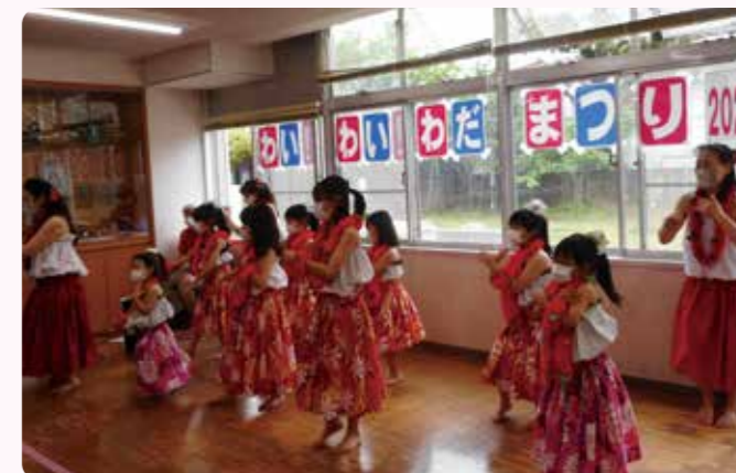
かわいらしいフラダンスの表演