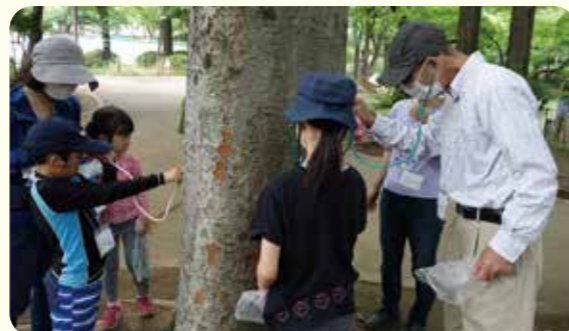
聴診器で木の音を聴いている

8月6日(土)に緑豊かな馬橋公園で、親子一緒にネイチャーゲームで自然を学び自然に親しむ体験をしました。当日は暑さも和らぎ、参加者はいっぱい遊んで学んで楽しい思い出を持ち帰ってくれました。