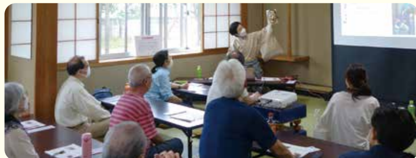
スライドと実物で解説する講師と聞き入る受講者

6月から7月に4回講座が好評のうちに終了しました。演者や能舞台、演目について、日本の伝統をわかりやすく解説していただき、謡の稽古もあって盛りだくさんの講座でした。