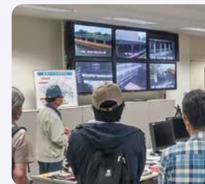
調節池についてレクチャーを受ける