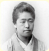
津田梅子

「小説津田梅子」~ハドソン河の約束~ —米国女子留学生による近代女子教育への挑戦— 音楽とともに明治初期の女子教育に挑む津田梅子の生涯を演じます。