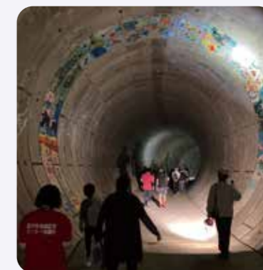
トンネル内には済美養護学校児童の壁画