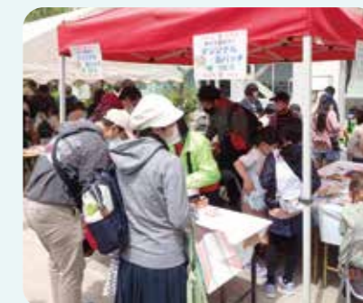
缶バッジづくり、木工細工には大行列