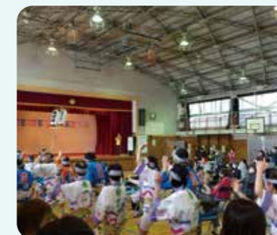
体育館のステージでは阿波おどり、エイサー、歌やフラダンス