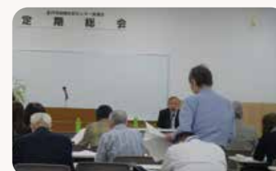
出席者による質疑応答

★こたえは「やきいも」でした。サツマイモをじっくり焼(や)いたものだけけど、これからが旬(しゅん)の野菜(やさい)だよ。