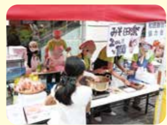
広場にはたくさんの模擬店が集結