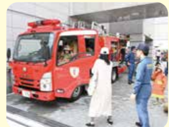
本物の消防車で消防士体験

●お問い合わせ・申込先/高円寺地域区民センター協議会 事務局 〒166-0011 杉並区梅里1-22-32 TEL:03-3317-6614