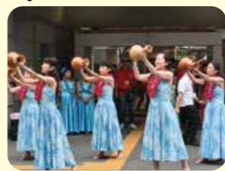
オープニングイベントのフラダンス 表演