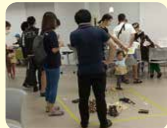
サイエンスワークショップ