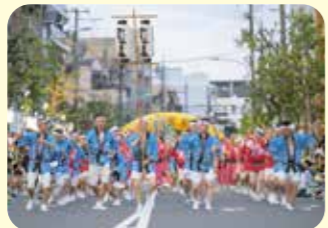
たくさんの観客の前で、一日限りのおじゃま連がスタート!