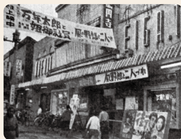
高円寺映画(昭和37年)