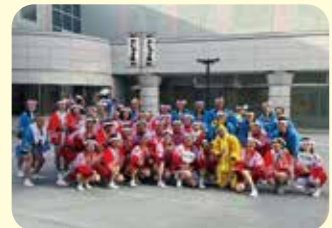
セシオン杉並体育室での猛特訓を終えて、いざ演舞場へ!

体育室での練習を経て、桃園演舞場・みなみ演舞場にて、明るく元気いっぱい踊り、特訓のかいあって素晴らしく揃った演舞を披露できました。また来年も開催できますように。