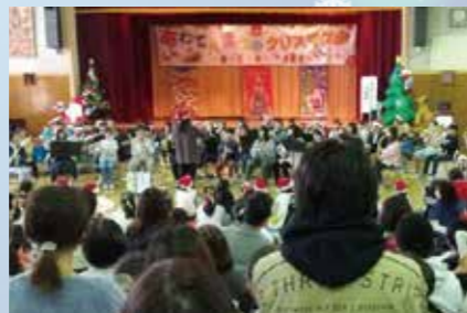
吹奏楽によるクリスマスソングメドレー