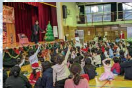
楽しいマジックショー