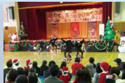
一輪車チームの表演