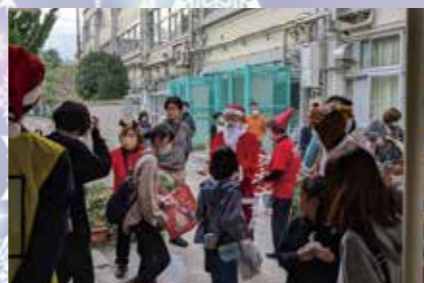
子どもたちにはクッキーのプレゼント