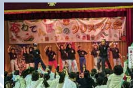
会場みんなで踊ろう!